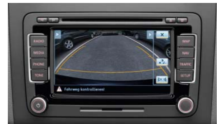
„Rear Assist“ zeigt den Fahrtweg und ggf. Hindernisse hinterm Fahrzeug.

Viele Fahrhilfen sind bereits als Serienausstattung oder als reguläre Sonderausstattung für Volkswagen Modelle erhältlich, z. B. Parklenkassistent „Park Assist“, automatische Fahrlichtschaltung, Regensensor, Geschwindigkeitsregelanlage, Rückfahrkamera „Rear Assist“ oder das schlüssellose Startsystem „Keyless Access“. Nähere Informationen dazu erhalten Sie von Ihrem Volkswagen Partner vor Ort, im jeweiligen Fahrzeugprospekt und im Internet unter www.volkswagen.de