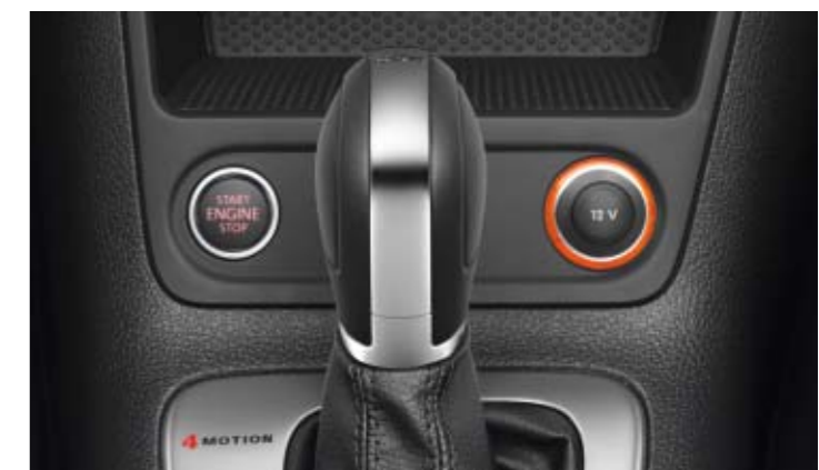
„Keyless Access“: öffnen und starten, ohne den Schlüssel herauszunehmen.