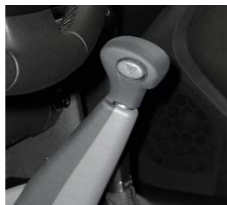
Handbediengerät „Compact“ für Gas und Bremse.