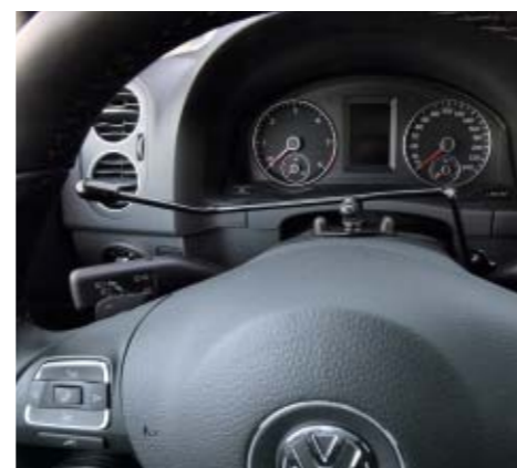
Zusätzlicher Wischerhebel links.